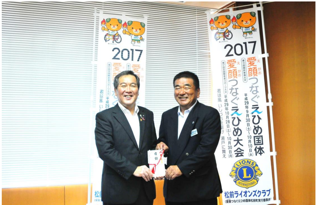
えひめ国体のぼり旗 130旗 贈呈式