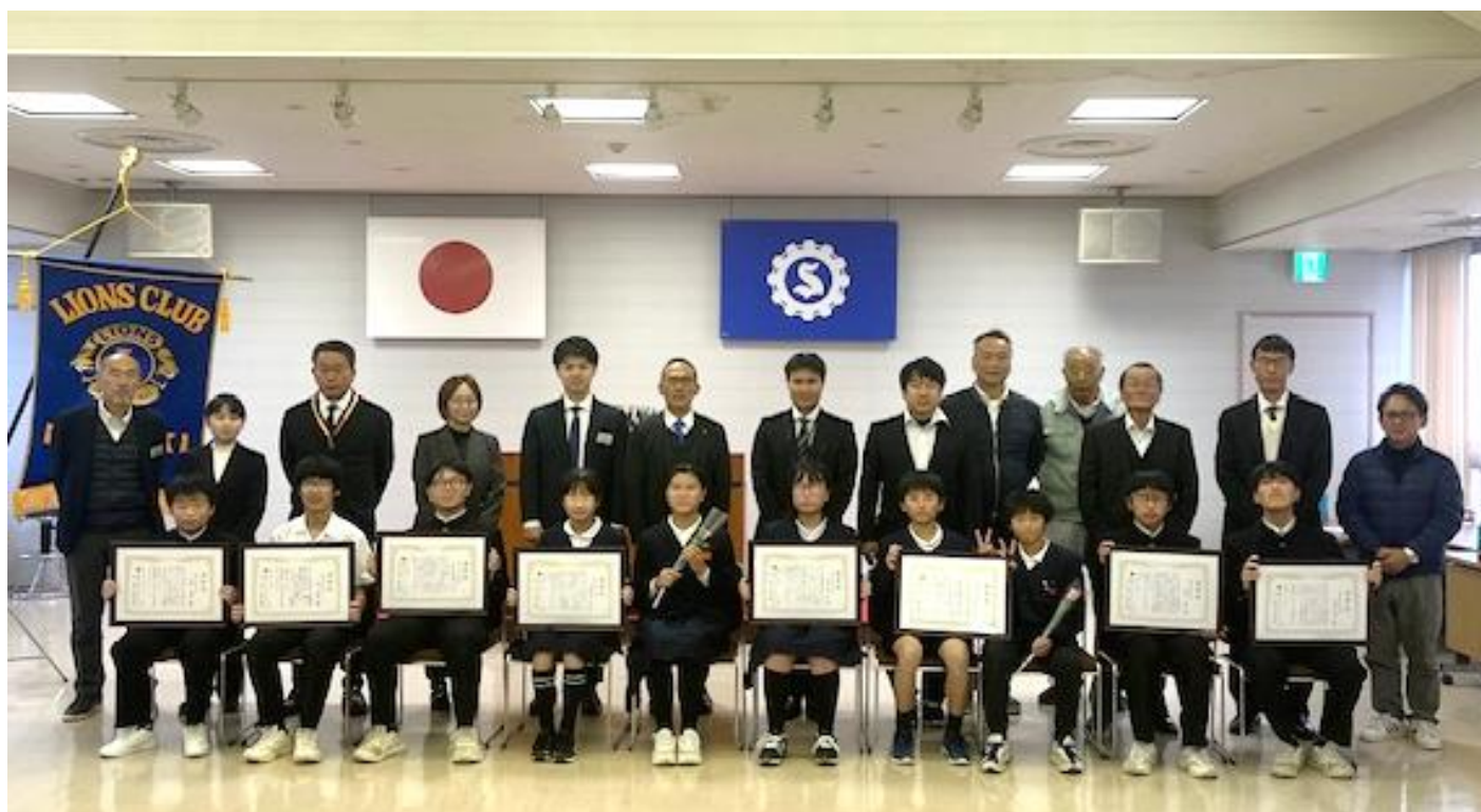
小さな善行者表彰式