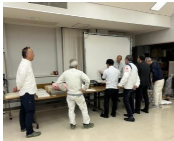
価格設定みんなで検討